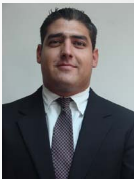
18 de Marzo