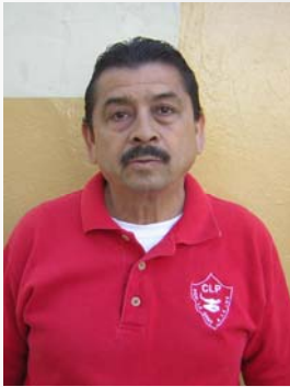
1 de Marzo