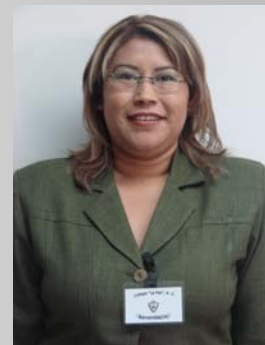
30 de Marzo